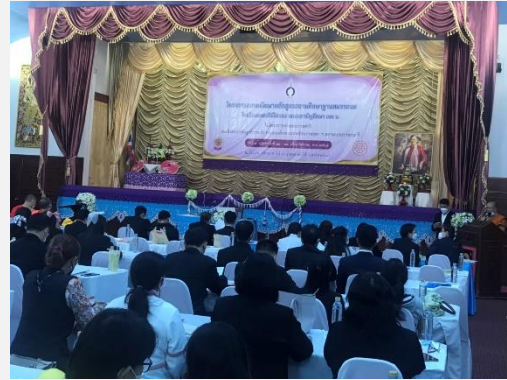
การประชุมสัมมนาผู้บริหารโรงเรียนพระปริยัติธรรม แผนกสามัญศึกษา