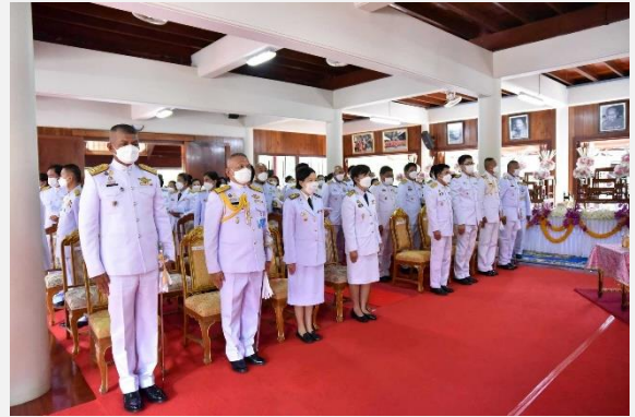
ผลผลิต : พระพุทธศาสนาได้รับการส่งเสริมและเผยแผ่หลักธรรม